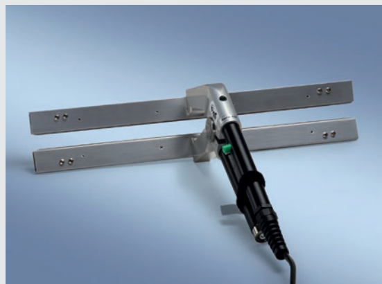
SCHNABELFORMZANGE 300 + 400 + 600 SFZ