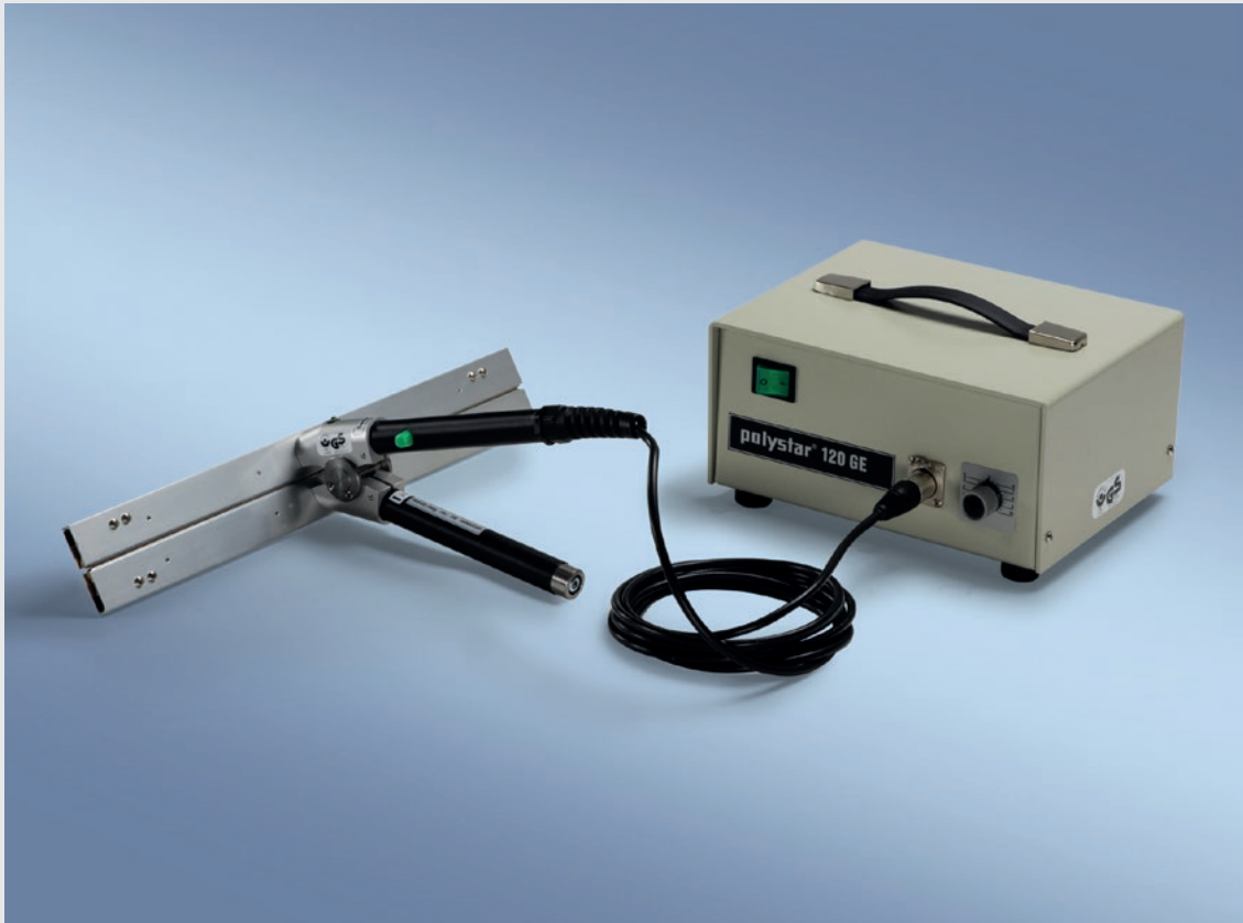
IMPULSGEBER 120 GE MIT STANDARD-SCHWEISSZANGE 300 D