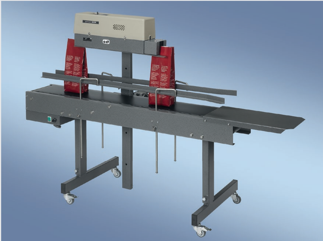
400 DSM-V MIT FAHRBAREM TRANSPORTBAND