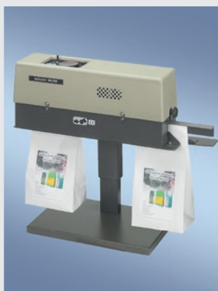
400 DSM MIT TISCHSTÄNDER