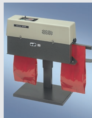
400 DSM-H MIT TISCHSTÄNDER